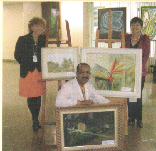
Exposição do DAC: obras foram adquiridas pela Fap

Ao lado do patrocínio a atividades de ensino e pesquisa, do financiamento de bolsas de estudo e atividades de capacitação para a comunidade Unifesp/SPDM, a Fap tem a proposta de apoiar eventos realizados pela instituição, como já fez em agosto, com o 29º Simpósio de Oftalmologia. Na área cultural, a Fundação patrocinou, com a aquisição das três obras vencedoras, a exposição de artes de funcionários organizada pelo Departamento de Assuntos Comunitários (DAC). Outra atividade que contou com apoio foi a mostra de trabalhos feitos por alunos da Escola Paulistinha, que teve como prêmio material escolar.