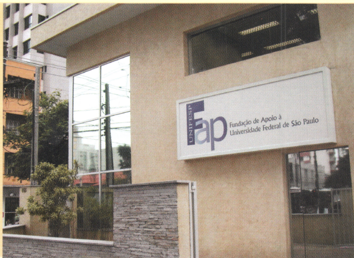
Setor de protocolo da Fap-Unifesp

A Fap estruturou um setor específico para captar recursos e desenvolver ações de marketing. A partir de agora, a Fap irá buscar novos parceiros em instituições públicas e privadas, procurando ampliar cada vez mais o leque de opções, a partir de observação minuciosa das demandas. Nada impede, por exemplo, que uma pesquisa focada em medicina esportiva obtenha recursos provenientes de uma indústria de material esportivo. A centralização do gerenciamento financeiro e administrativo permite ainda que o setor de compras obtenha negociações mais vantajosas, com custos menores, além de estabelecer convênios com mais benefícios.