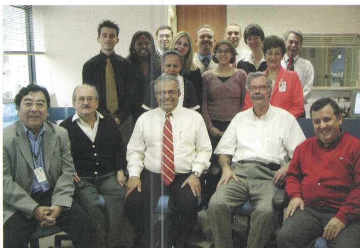
Diretoria e equipe da Fap-Unifesp: missão é viabilizar ações institucionais

Criada em 2005, a Fundação de Apoio à Universidade Federal de São Paulo (Fap-Unifesp) está em plena operação. Atua na captação de recursos financeiros destinados a apoiar as atividades de ensino, pesquisa e extensão, por meio de convênios e contratos.